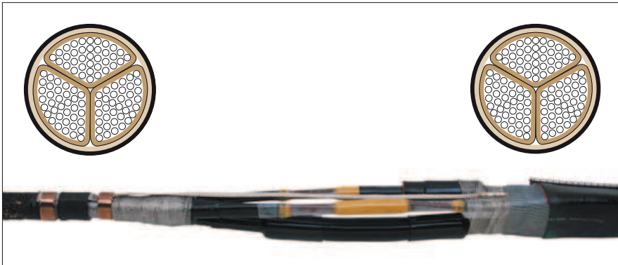
Кабель с экраном для каждой жилы