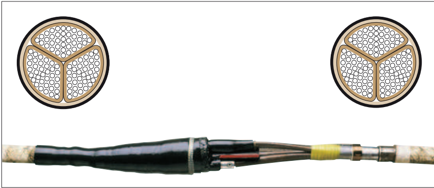
Кабель с общим экраном